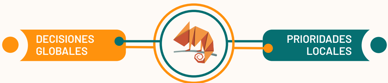
FIGURA 11 | TRANSFORMA COMO BISAGRA

En un escenario global incierto, nuestra apuesta ha sido clara: sostener y ampliar los espacios donde la cooperación sigue siendo posible, y donde América Latina puede ejercer liderazgo desde la colaboración, el conocimiento compartido y la acción colectiva.