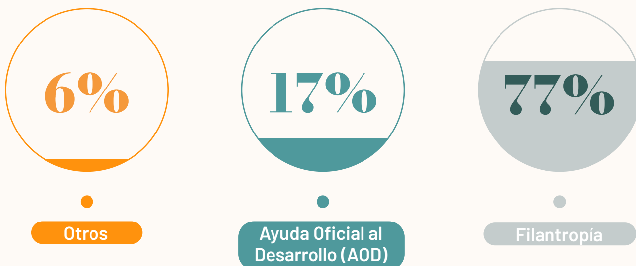
GRÁFICO 1 | DISTRIBUCIÓN PORCENTUAL DE LAS FUENTES DE FINANCIAMIENTO (2025).

La evolución organizacional también se tradujo este año en el fortalecimiento de nuestro core institucional. Además del talento técnico y programático, Transforma ha consolidado su estructura de Operaciones, Estrategia y Comunicaciones. Esto condujo a una alineación mayor entre lo que hacemos, cómo lo hacemos y cómo lo comunicamos , avanzando de manera decidida desde el reporte de actividades hacia una narrativa clara de impacto.